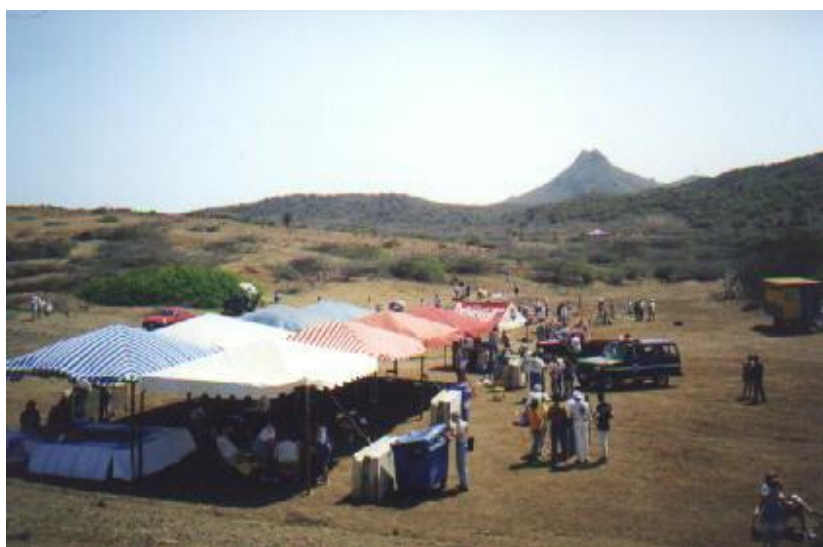
Bij Boka Tabla waren er vrij veel mensen om de totale zonsverduistering van 26 februari 1998 goed te kunnen volgen.

Op maandag 21 augustus zal er een zonsverduistering optreden. Wanneer een zonsverduistering optreedt, trekt de maan precies tussen de zon en de Aarde. Bij een totale zoneclips, zal vanaf een klein deel van de Aarde de zon volledig door de maan bedekt