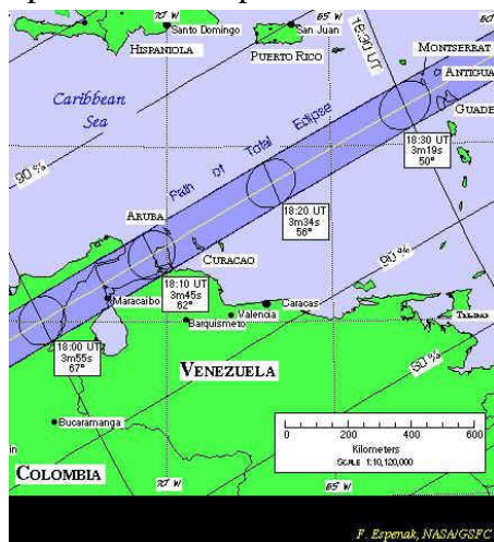
Deze kaart toont het pad van de totaliteit van de zonsverduistering van 26 februari 1998.

gedeeltelijke zoneclips, die op Curaçao zichtbaar zal zijn, vindt pas op 14 oktober 2023 plaats.